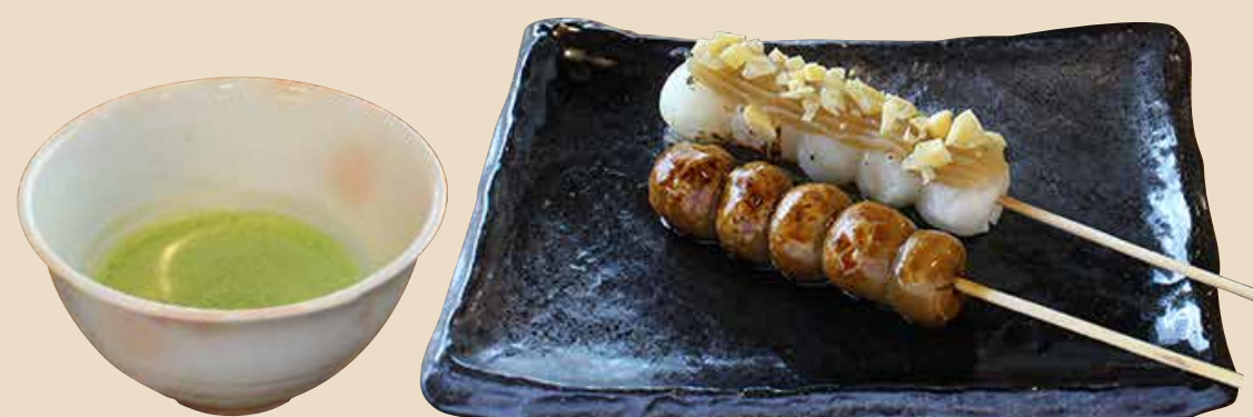
6 栗あんだんご・そばだんご〜抹茶セット〜 ※ゆで釜は一緒です。