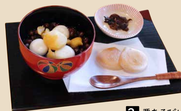
3 栗あそびぜんざい

【乳成分・小麦・アーモンド・卵・りんご・オレンジ・もも/香り付けにアルコールを使用】