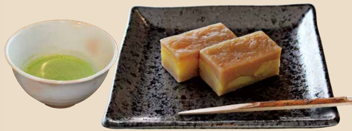
7 栗蒸ようかん〜抹茶セット〜