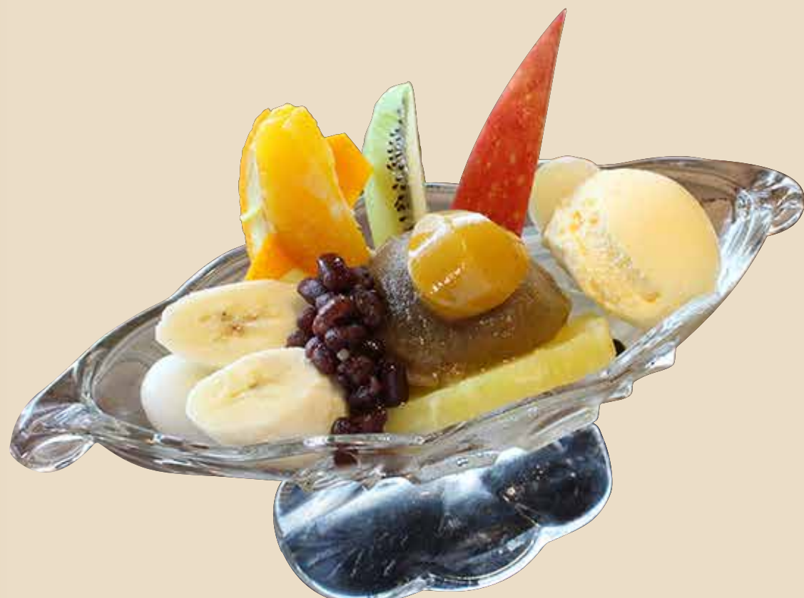
1 栗タクリームあんみつ