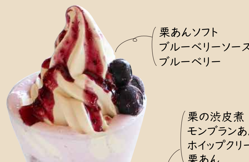
栗あんソフト ブルーベリーソース ブルーベリー