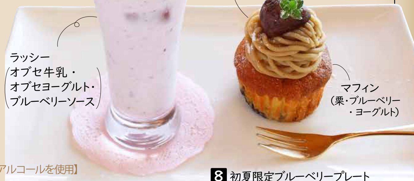
ラッシー オブセ牛乳・ オブセヨーグルト・ ブルーベリーソース